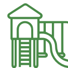
Parque de juegos infantiles